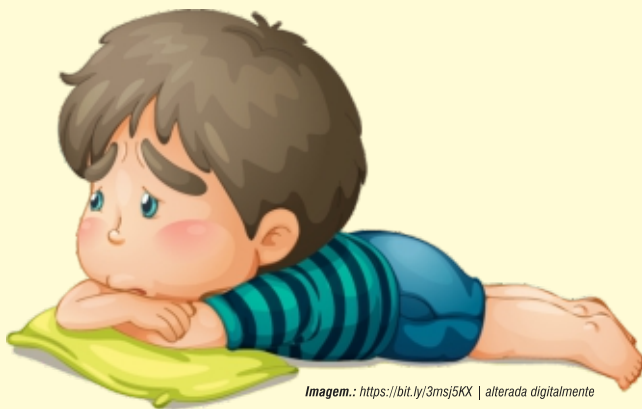
Imagem.: https://bit.ly/3msj5KX | alterada digitalmente