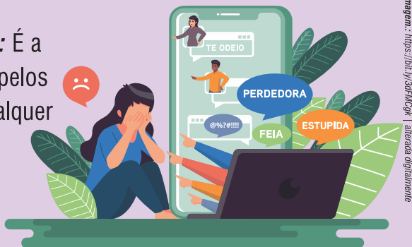
Imagem: https://bit.ly/3dFM0ck | alterada digitalmente

ELETRÔNICO OU CYBERBULLYING: É a agressão feita pelas redes sociais, pelos aplicativos de conversas ou por qualquer meio eletrônico.