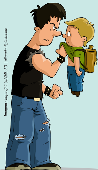
Imagem.: https://bit.ly/2D4Ls60 | alterada digitalmente

A TESTEMUNHA: Não se envolve diretamente nas agressões, mas assiste, nem sempre toma partido, pois muitas vezes tem medo de piorar a situação ou acabar sendo ele a vítima.