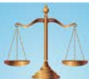
Comissão Permanente de Constituição, Justiça e Redação

As Comissões estudam, investigam e apresentam conclusões ou sugestões em relação a projetos e temas de interesse do município. Na Câmara de Limeira há oito Comissões Permanentes, cada uma composta por cinco vereadores. São elas: