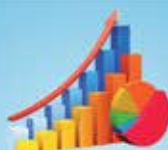
Comissão Permanente de Orçamento, Finanças, Contabilidade e Adm. Pública