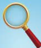
Comissão Permanente de Controle e Fiscalização dos Atos do Poder Executivo