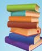
Comissão Permanente de Educação e Cultura