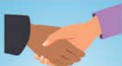
Comissão Permanente de Defesa dos Direitos Humanos, dos Direitos do Consumidor, dos Direitos da Criança e do Adolescente e dos Direitos do Idoso